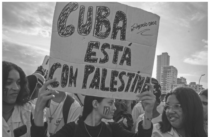
Kuba an der Seite Palästinas