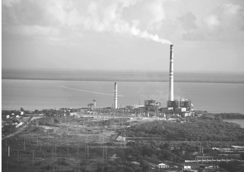
Zur Zeit basiert die Stromerzeugung in Kuba zu 95 % auf der Verwendung fossiler Brennstoffe.

"Die Nachfrage nach Energie in Kuba kann nicht befriedigt werden, da wir von fossilen Brennstoffen abhängig sind, die größtenteils importiert werden, was die Wirtschaft des Landes und die Lebensqualität der Bevölkerung erheblich beeinträchtigt und sich aufgrund der Verbrennung von Kohlenwasserstoffen und der daraus resultierenden Emission von