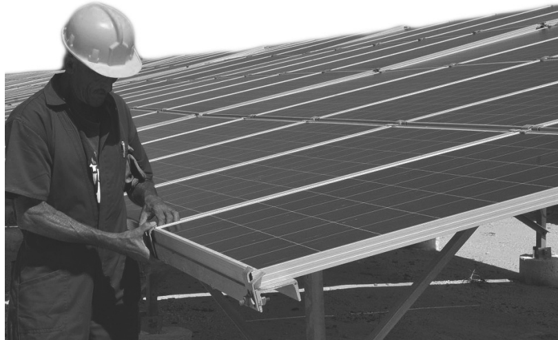
Kuba verfügt über ein hohes Solarphotovoltaikpotenzial

Alle zukünftigen Investitionen - und das gehört zu der Denkweise, die es einzupflanzen gilt - müssen als wesentliche Komponente die erneuerbaren Energiequellen haben. Das ist eine obligatorische Bedingung“, sagte er zum Schluss. •