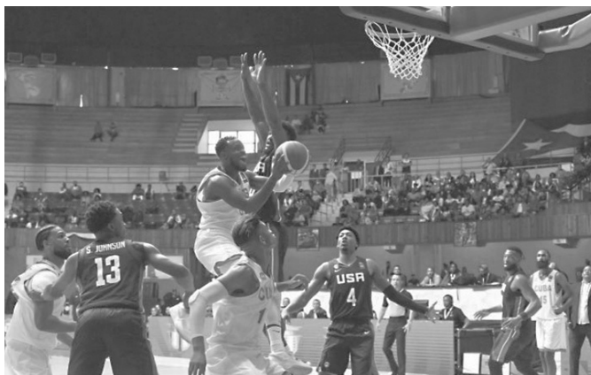
Die Kubaner errangen einen historischen Sieg

Gestern haben wir eine Mannschaft geschlagen, die uns an Erfahrung und Qualität der Ligen, in denen ihre Spieler tätig sind, weit übertrifft: die Vereinigten Staaten. Das kubanische Quintett begann stürmisch, und nach dem ersten Viertel (26-10) hatten wir bereits einen komfortablen Vorsprung, den wir bis zum Ende