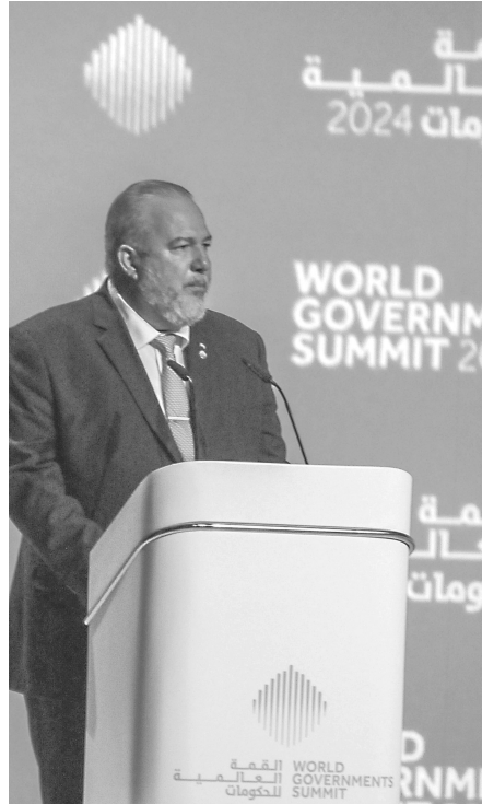
Unsere Regierung wird weiterhin Solidarität, Komplementarität, Zusammenarbeit und Dialog zwischen den Völkern fördern, um zu zeigen, dass eine bessere Welt möglich ist

Die zunehmende Privatisierung von Wissen muss