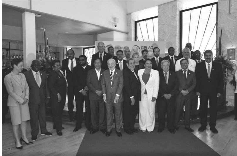
Der Frieden in Lateinamerika und der Karibik muss auf der Achtung von Prinzipien und der Nichteinmischung in innere Angelegenheiten beruhen, sagte die honduranische Präsidentin Xiomara Castro.

Den Frieden zu unterstützen bedeutet, das Recht eines jeden Volkes zu verteidigen, sein politisches Modell und seinen eigenen Weg zur wirtschaft-