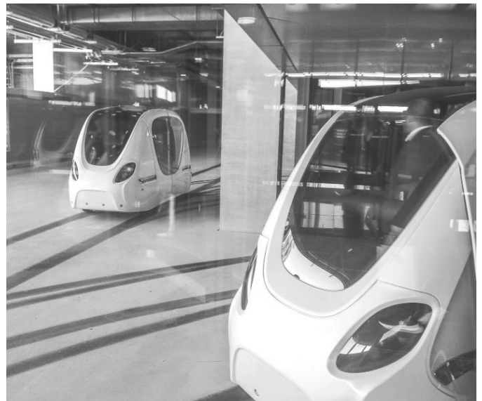
Masdar ist die erste kohlenstofffreie Stadt der Welt