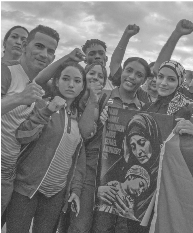
Kuba erhebt seine Stimme für Palästina