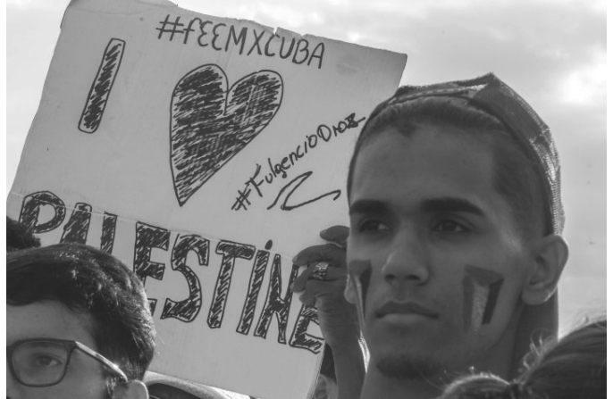
Für ein freies Palästina

„Palästina verdient es, in Frieden zu leben. Die Welt verdient den Frieden, um leben zu können.“ •