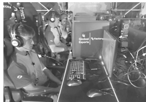
In Kasan wird Kuba seinen Entwicklungsstand, was neue Technologien im Bereich des Sports angeht, vorstellen - ein Sektor, der hier sehr populär geworden ist