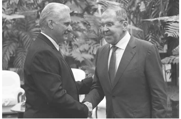
Lawrow sprach über das Ziel, die rechtliche Grundlage für die Annäherung zwischen Kuba und Russland zu schaffen.

In diesem Sinne betonte er auch die kulturellen Beziehungen, die traditionell sehr gut seien. Er ging auch auf die sportlichen