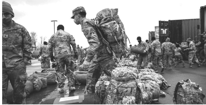
Nach dem Ende des Koreakrieges konnten die US-Armeen keine Siege mehr verbuchen. Im Bild: der Abzug der Truppen aus Afghanistan

Die Hegemonie ist als ein System zu verstehen, das wirtschaftliche Faktoren durch die Expansion großer Konzerne