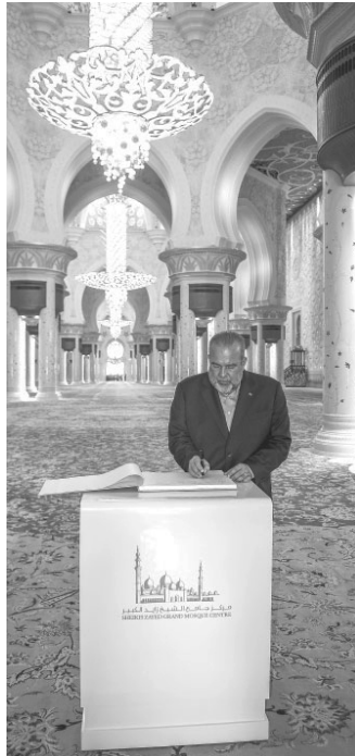
„Die Große Moschee spiegelt die Eleganz der emiratischen Architektur wider“, schreibt Marrero Cruz.

„Hier atmet man Frieden, Ruhe und Mitgefühl, und das wiederum ist ein guter Ort, um sich inspirieren zu lassen und die Träume der Gründerväter zu verwirklichen. Dies ist ein großartiges Werk, das nicht nur für die Emirate, sondern für die ganze Welt bestimmt ist. Hier lernt man Kultur und Traditionen kennen und schätzen, hier lernt man etwas. Es war mir eine Ehre, dieses Land besuchen zu dürfen“, sagte der Premierminister zu seinen Gastgebern, als er mit der gleichen Zuneigung verabschiedet wurde, die wir seit unserer Ankunft in diesem freundlichen Land verspürt haben.