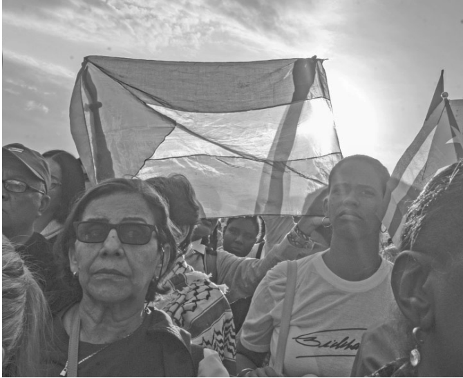
Jede Stimme zählt