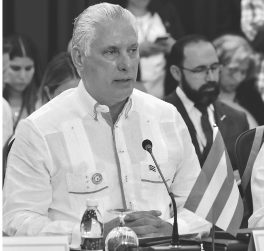
„Es ist an der Zeit, 'ein einziges Vaterland' zu schaffen, wie Simón Bolívar es sich erträumt hat“, sagte der kubanische Präsident.

In dieser Region gibt es 183 Millionen Menschen, die als arm gelten. Das sind 29 %