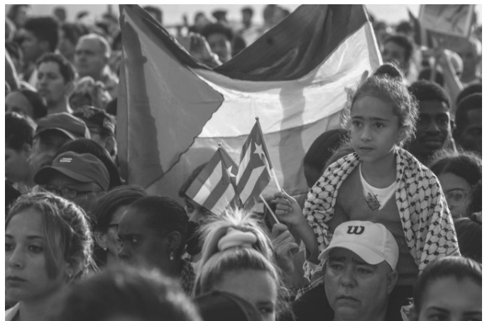
Unsere ganze Solidarität und Unterstützung für das palästinensische Volk