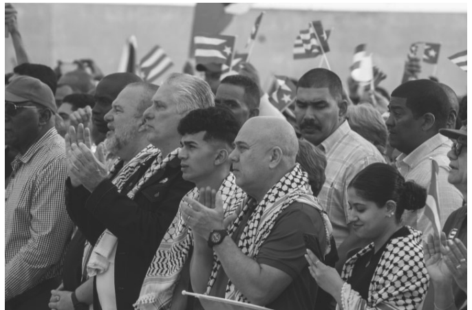
Kuba wird dem Verbrechen nie gleichgültig gegenüberstehen