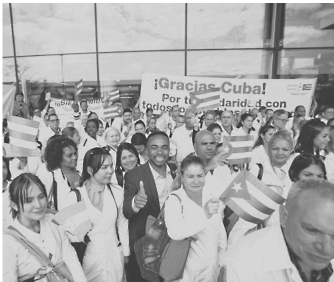
Die Ankunft unserer Ärzte ist das Ergebnis eines Kooperationsabkommens

Razones de Cuba , wo die verschiedensten Akte politischer Subversion gegen die Insel angeprangert werden, enthüllte eine von Martí Noticias durchgesie-