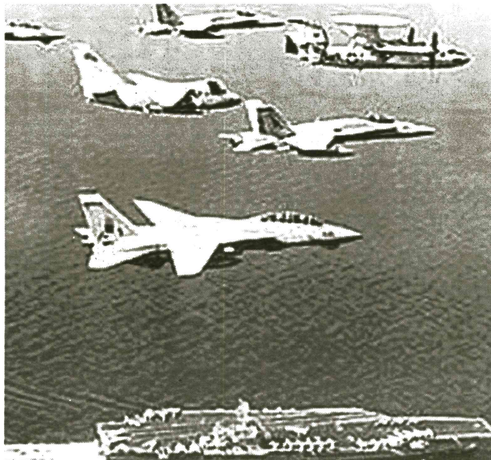
US-Militärpräsenz im Persischen Golf

Damals besaß der Staat Israel keine einzige Atomwaffe. Das Imperium besaß eine enorme und unvergleichbare atomare Macht. Zu jener Zeit war es, wo den Vereinigten Staaten die abenteuerliche Idee einfiel, mit Israel einen Gendarmen im Mittleren Osten zu schaffen, der heute einen bedeutenden Teil der Weltbevölkerung bedroht und im Stande ist, mit jener Unabhängigkeit und jenem Fanatismus zu handeln, die ihn auszeichnen.