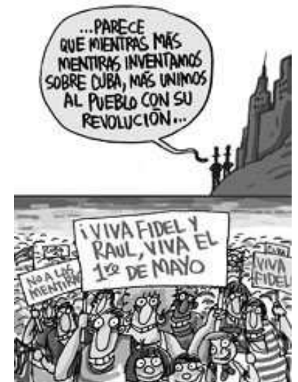
... kaum zu glauben, wieviele Lügen über Cuba verbreitet werden, und wie verbunden das Volk mit seiner Revolution ist ...