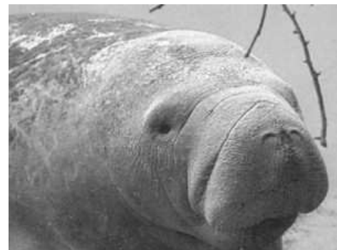
Karibik-Manati – eine Rundschnanzseekuh

1. Island, 2. Schweiz, 3. Costa Rica, 4. Schweden, 5. Norwegen, 6. Mauritius, 7. Frankreich, 8. Österreich und 9. Cuba. R. F., cubadebate